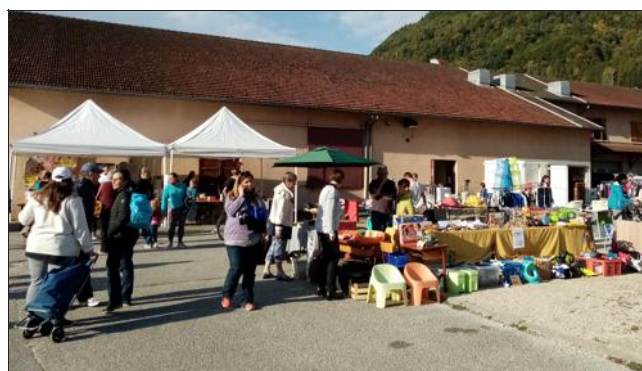
À l'extérieur, le soleil a réjoui les participants.

Le Sou des écoles de Crêts-en-Belledonne organisait sa première manifestation ce dimanche 13 octobre avec la Bourse d'automne dans la salle des fêtes et sur la place du foyer de Saint-Pierre d'Allevard. Les exposants étaient venus nombreux et le public était également bien présent pour profiter de cette magnifique journée. Tous les emplacements intérieurs étaient occupés ainsi que les 100 autres à l'extérieur. Comme à son habitude, le Sou des Écoles tenait un stand de dépôt-vente dans la salle où une trentaine de listes de vêtements avaient été déposées. Une buvette était installée à l'extérieur tenue par une équipe de bénévoles toujours de bonne humeur. Chacun pouvait se restaurer à volonté : boissons, crêpes, frites, hot-dog et pour les plus jeunes des bonbons. Tous sont repartis ravis de cette journée.