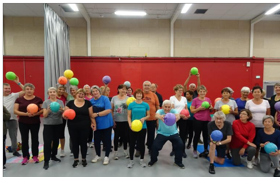
Le groupe des joyeux gymnastes.

Malgré les fortes averses de ce mardi matin, la séance de gymnastique douce habituelle, comme les deux séances de Pilate données par Béatrice, a connu une grosse participation.