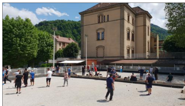
Avec le beau temps, les jeux sont pleins.

La saison se termine pour certaines associations saisonnières, comme le club de pétanque allevardin. Cependant, avec la belle météo de ces derniers jours, les joueurs ont du mal à ranger leurs boules. Ils se retrouvent donc dès que possible sur les jeux du pétanquodrome qui verra cette année peut-être repoussé sa date record de fermeture du 8 décembre... tous en rêvent ! En attendant, l'assemblée générale aura lieu ce samedi 19 octobre à 18 h 30, en salle du conseil à la mairie d'Allevard. Le mandat du bureau s'achève et en fin de réunion l'élection d'une nouvelle équipe sera soumise au vote. La soirée s'achèvera au pétanquodrome autour du verre de l'amitié.