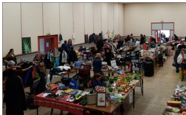
De nombreux exposants avaient investi l'intérieur de la salle.