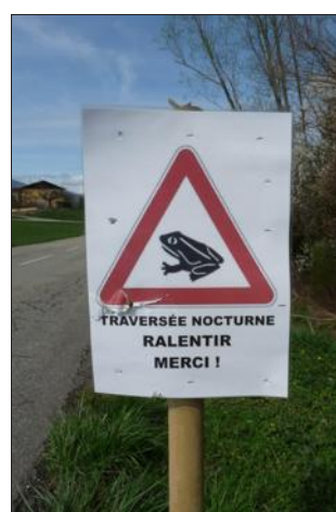
Un des fameux panneaux ! Deux ouvrages hydrauliques de régulation gèrent à présent les niveaux d'eau pour éviter l'atterrissement du marais et lui fournir un meilleur équilibre, l'endroit étant fortement peuplé en crapauds, grenouilles (agiles et rousses) et tritons alpestres et palmés.

Maintenant, reste à savoir si la rainette verte, plutôt rare, décidera d'y revenir... C'est une des raisons aussi qui a incité la commune à planter des panneaux le long de la RD9, contiguë au marais, pour sen-