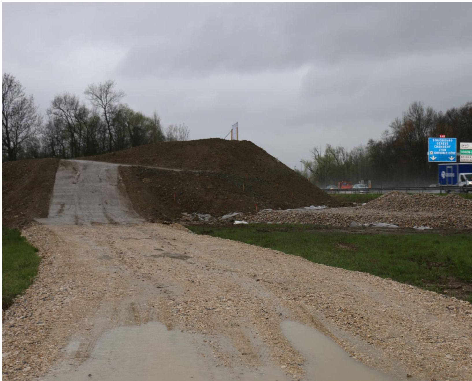
Pour l'instant, seulement deux monticules sont visibles de chaque côté de l'A48, entre le péage de Voreppe et celui de Moirans.

Les travaux sont visibles depuis l'A48, entre le péage de Voreppe et celui de Moirans. Un passage pour la faune est en cours de construction. Concrètement, un pont au-dessus des voies permettra aux animaux de toutes tailles de traverser.