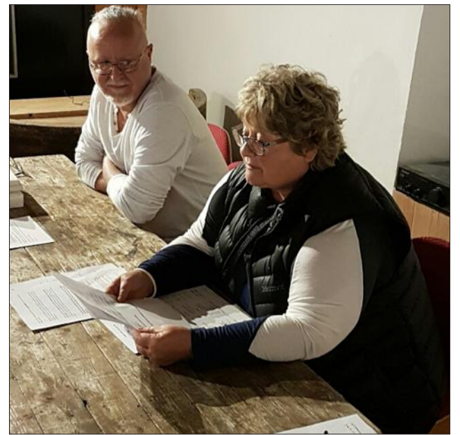
La présidente et le trésorier ont dirigé l'assemblée générale.