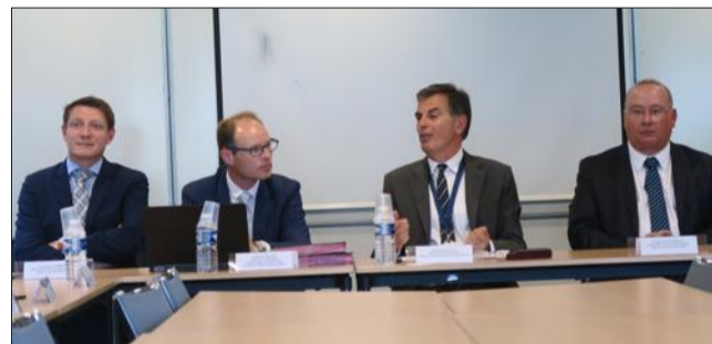
Les procureurs de Vienne et de Grenoble entourant le procureur général et son secrétaire général, hier.

Cette convention engage, d'une part, le parquet général de Grenoble, les cinq parquets de son ressort (Grenoble, Bourgoin-Jallieu, Vienne, Gap et Valence), les services de police et de gendarmerie de l'Isère, de la Drôme et des Hautes-Alpes et, de l'autre, les Ligues Méditerranéenne et Auvergne-Rhône-Alpes de football, ainsi que les sections régionales de l'Union nationale des arbitres de football.