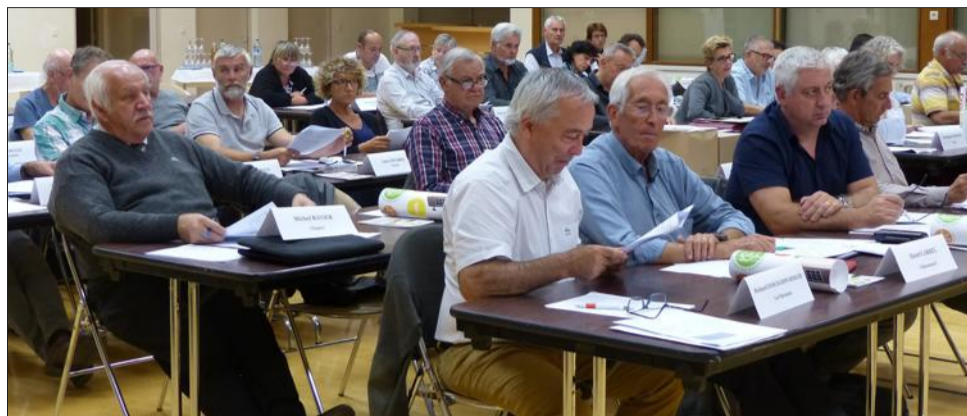
La modification des statuts a soulevé le principal débat du conseil communautaire.

Ces dernières portent sur un renouvellement (politique du logement et du cadre de vie), une intégration (création, aménagement et entretien de la voirie des zones économiques ; création et gestion des maisons de service au public ; assainissement) et un complément (action sociale