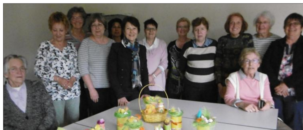
Le groupe se retrouve après un atelier créatif.

Le club "Touchatout" a repris ses activités, à savoir, les rencontres du mardi après-midi à la salle de La Tour avec des jeux de société, un atelier mémoire, des