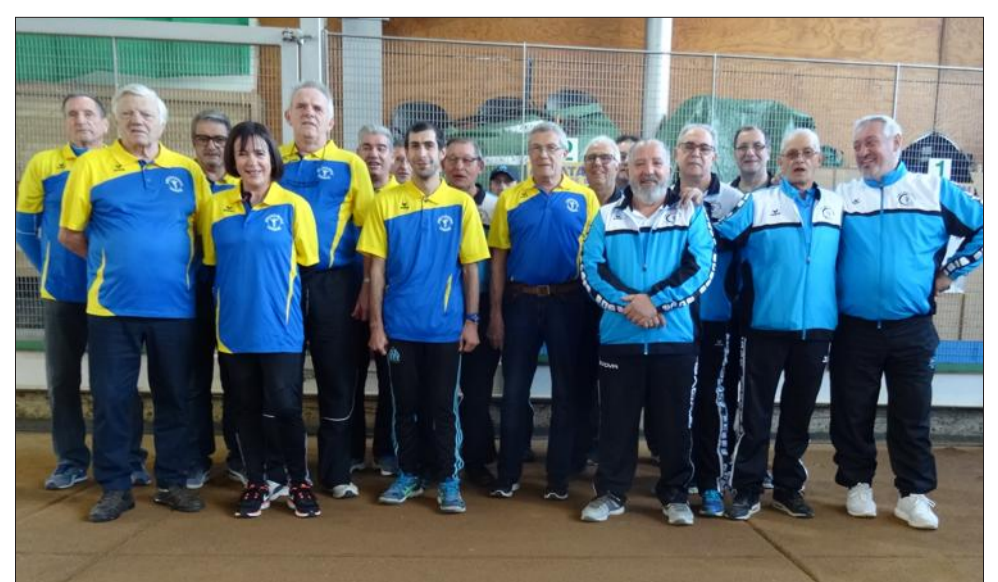
Maillots bleus et jaunes pour les visiteurs et bleus et blancs pour les locaux.

La loi du sport est parfois sévère, certes, mais le cumul de deux manifestations successives peut peut-être expliquer cette défaite. Les joueurs locaux avaient en effet participé la veille au concours de belote du club bouliste. Reste maintenant le match retour pour tenter de se rattraper.