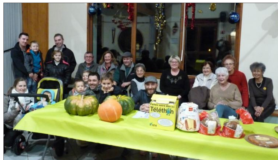
Les jeunes sont appelés à prendre la relève dans le tissu associatif et solidaire saint-maximinois.

Samedi, les aînés des Cygnes de la Tour et les adhérents de l'Association sportive de Saint-Maximin, rejoints cette année par ceux de Bien vivre à Saint-Maximin, ont tenu à rejoindre le Téléthon, auquel la commune participe depuis 2001. Bien que l'ampleur de l'événement communal puisse sembler peu spectaculaire, il a tout de même donné une semaine de travail aux bénévoles.