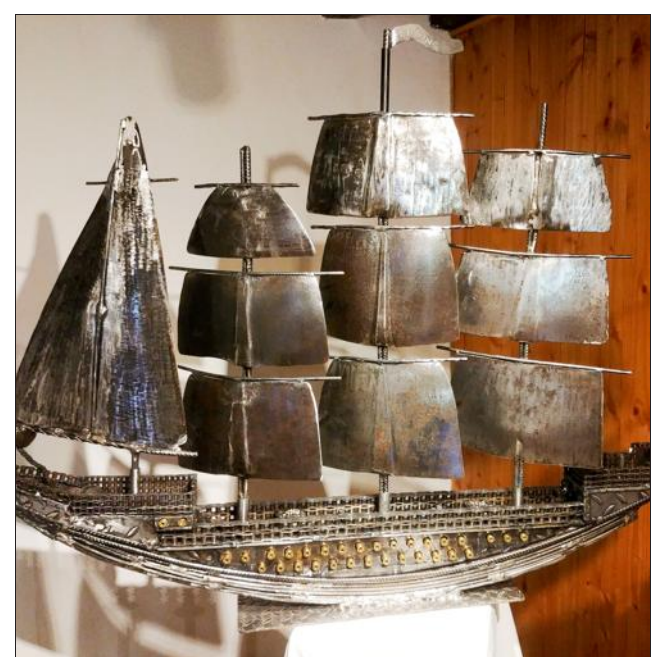
"Le galion" de Jacques Carezni, prix du public.