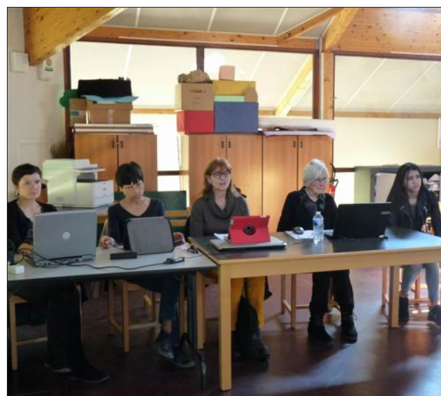
Quelques personnes ayant suivi les cours l'année dernière.