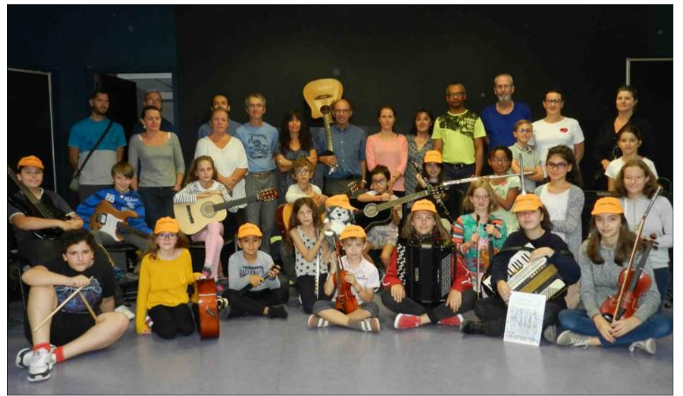
Les jeunes musiciens et leurs familles. Vous retrouverez "Les loups folk" en représentation lors de la cérémonie du 11-Novembre à Murianette.