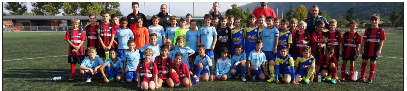
Les petits joueurs réunis avec les éducateurs.

Seule rencontre à domicile, ce samedi, sur le stade Emé-de-Marcieu, les éducateurs du club accueillent le matin leurs petits voisins des équipes locales.