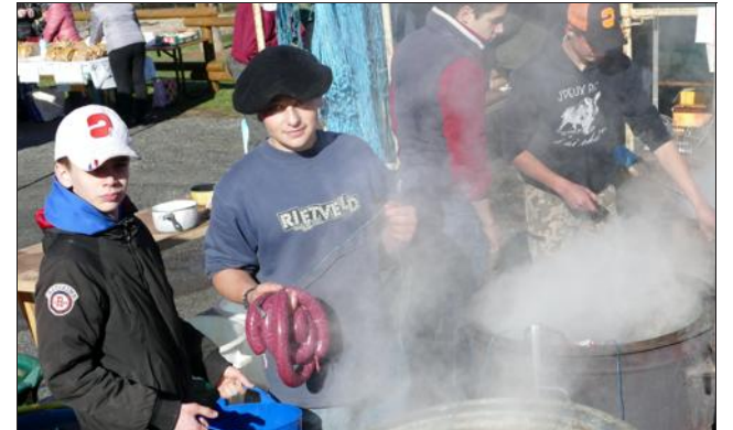
Le boudin cuit à la chaudière.

La 48 e foire au boudin sous un beau soleil