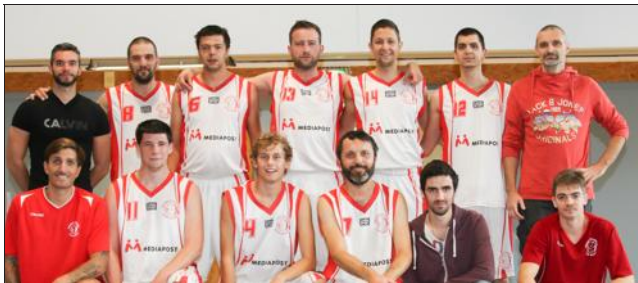
L'équipe des seniors réalise une belle remontée.

Basket : quatrième victoire consécutive pour l'équipe seniors