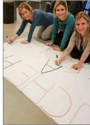
Les parents d'élèves du groupe scolaires Jules-Ferry restent mobilisés contre la fermeture d'une classe de CP à la rentrée. En plus, ils ont le soutien du maire.

Mieux, le maire s'est engagé à faire voter ce jeudi soir au conseil municipal une motion de soutien. Et il a même accepté de leur mettre à disposition la salle des fêtes, le mardi 26 mars à 20 heures, pour qu'ils puissent tenir une réunion publique. « Nous souhaitons alerter et informer l'ensemble des habitants de la commune de cette décision, que nous jugeons injustifiée. » Des parents d'élèves qui auront l'occasion de le redire de vive voix à l'inspectrice (1) qu'ils doivent rencontrer dans les prochains jours. Le maire doit égale-