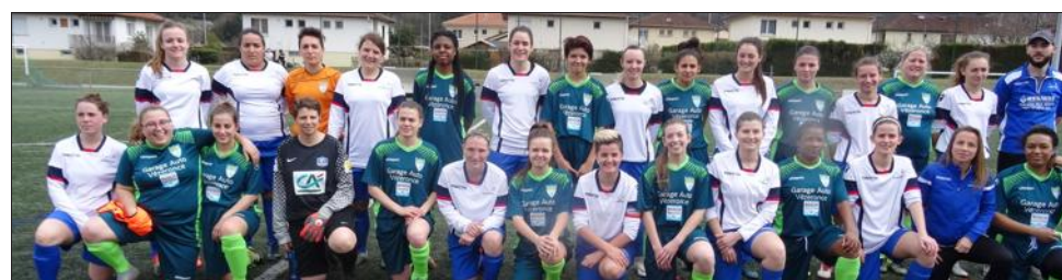
Les deux équipes avant le match.

Ce dimanche sur la pelouse synthétique du stade Emé de Marcieu, la rencontre qui opposait les féminines à 11 de l'AS Grésivaudan à leurs homologues de Vézeronce (près de Morestel) a vu la victoire de finale de l'équipe locale par 1 but à 0. Sous un