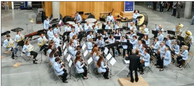
L'harmonie jouera un répertoire éclectique pour son gala.

Samedi 8 juin au Coléo, à 20 h 30, l'harmonie Les enfants de Bayard (HEB) de Pontcharra donnera son concert de gala.