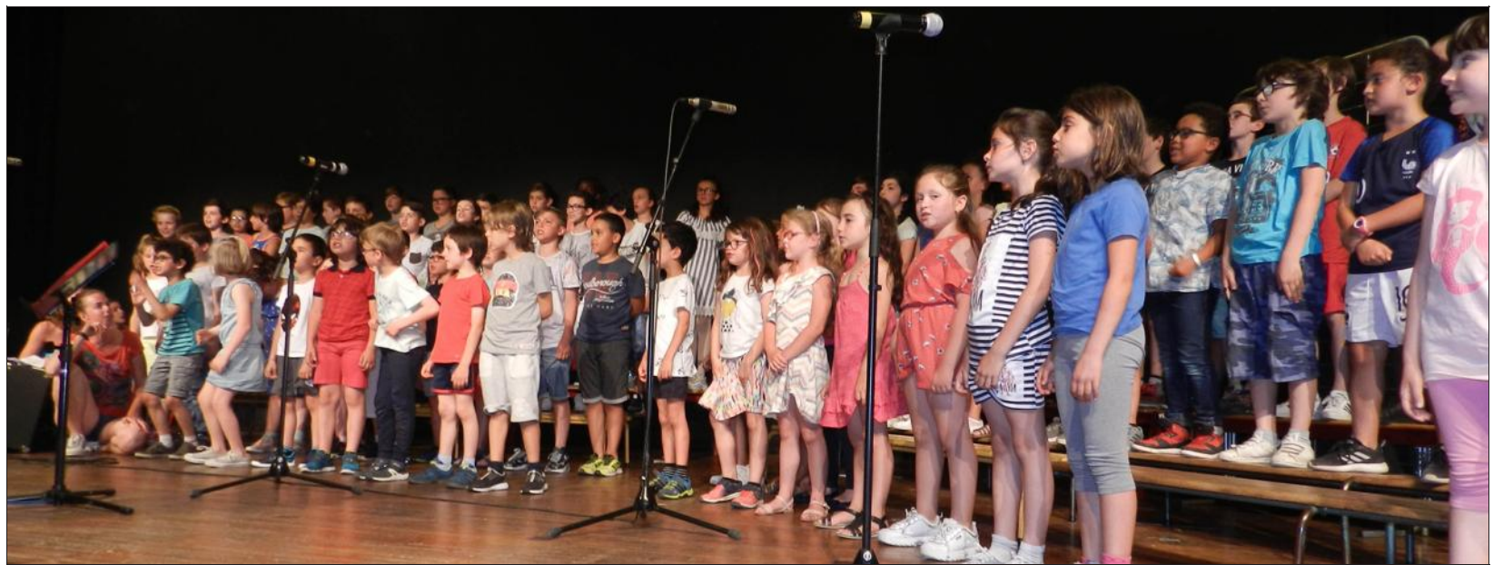
Des centaines d'écoliers se sont succédé sur la scène de l'Escapade.

Chaque année, les classes des écoles élémentaires de Domène proposent, salle de l'Escapade, un rendez-vous musical incontournable pour les parents et amis des élèves.