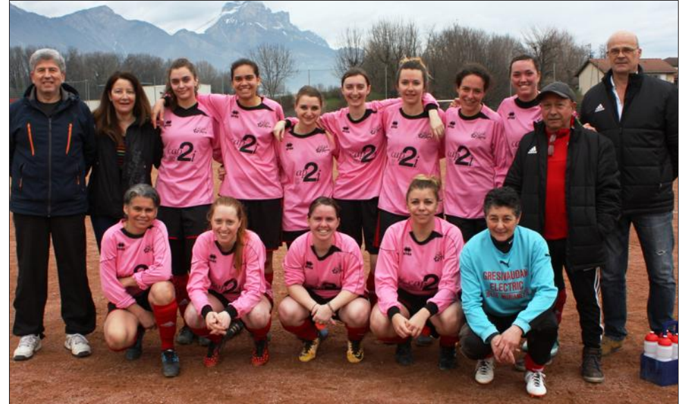
Très appliquées, les joueuses de l'ASJF ont battu Vallée du Guiers sur un score sans appel (5-0).