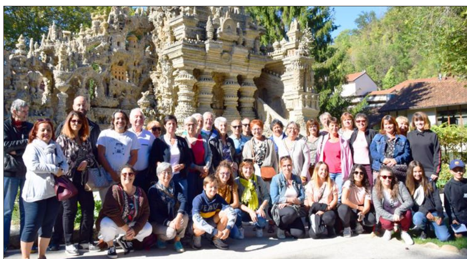
Dimanche, 42 personnes ont répondu à la proposition de l'association "Et si on sortait", pour une sortie direction la Drôme. Les participants sont partis à la découverte du palais idéal du facteur Cheval, à Hauterives, et de la cité du chocolat à Tain-l'Hermitage.