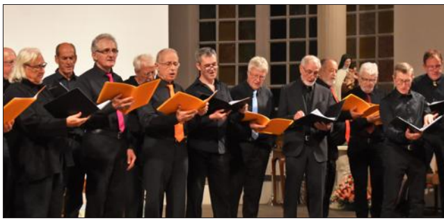
Les Grésivaudans et les Virili Voci réunis.

Deux chœurs ont ouvert la saison musicale de l'église Sainte-Thérèse