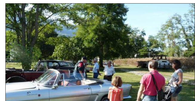
Des véhicules étaient exposés par l'Allevar Rétro automobile.

Samedi, le Grésivaudan Vapeur club (GVC) a accueilli 250 personnes. Pour ces avant-dernières portes ouvertes, il y avait aussi une exposition de trains réalisés au 1/20 e ou 1/22,5 e , venant du Viviers-du-Lac et d'Allevar, et de vieilles voitures de l'Allevar Rétro automobile.