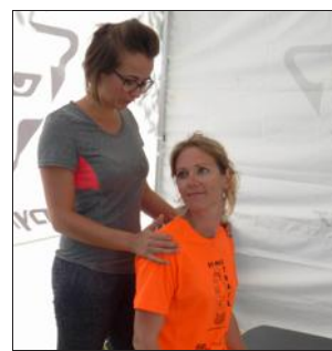
Les gestes de la chiropraticienne ont été appréciés.