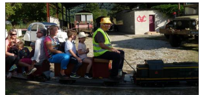
Une des machines promenant le public.

250 personnes pour une journée à toute vapeur