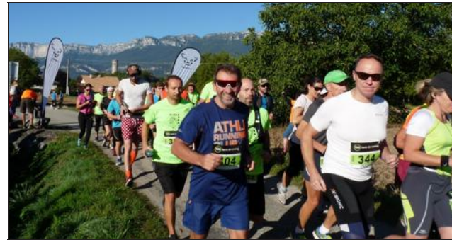
Le départ de la course de 10 km.