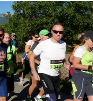
C'est parti pour 8 km de marche !