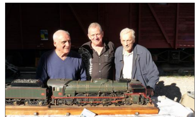
Des trains réalisés au 1/20 e s véhicules étaient exposés.