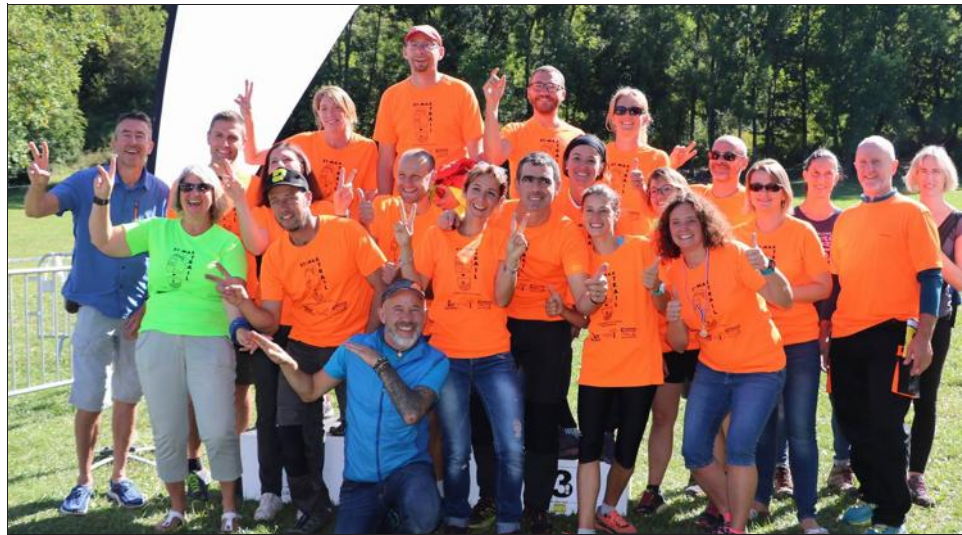
Les bénévoles de Vive l'école étaient ravis de cette 2 e édition du trail.

283 inscriptions ont été enregistrées, dépassant les attentes des organisateurs.