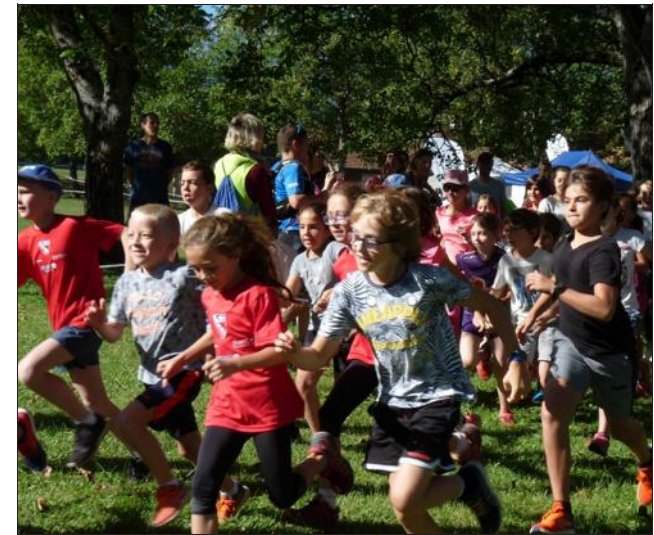
Les enfants ont aussi eu leur course.