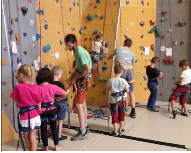
Le club de Bréda Roc peut accueillir des enfants lors des séances d'escalade sur le mur de la Pléiade.

Le club d'escalade de Bréda Roc a repris les entraînements de grimpe. Les moniteurs professionnels, titulaires d'un brevet d'état d'éducateur sportif, dispensent les cours les mardis et mercredis soir pour les jeunes de 6 à 66 ans sur le mur d'escalade de La Pléiade. C'est l'occasion pour les plus jeunes de découvrir une discipline sportive ludique, permettant de développer la force musculaire mais aussi la souplesse. Le club a des places de disponible et peut accueillir des enfants de 6 à 9 ans pour cette saison. Si les plus jeunes sont motivés pour constituer un groupe performant, Bréda Roc leur permettra de participer aux compétitions d'escalade de la région, une belle activité au programme des jeux olympiques de 2020.