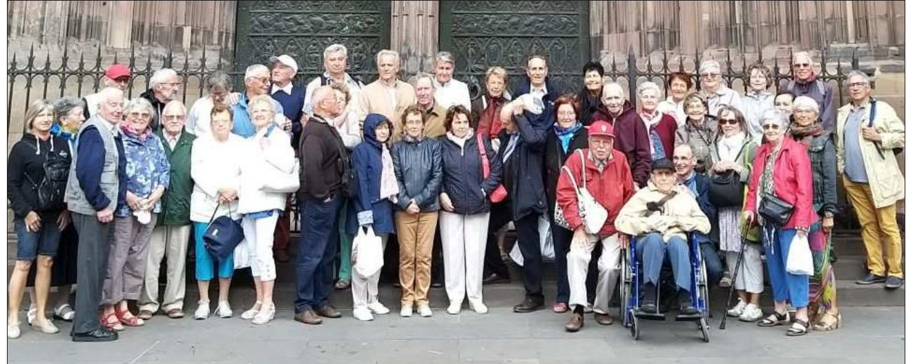
Le groupe a posé devant la cathédrale de Strasbourg.

Le voyage s'est poursuivi à Obernai, ville médiévale, berceau de Sainte-Odile, pa-