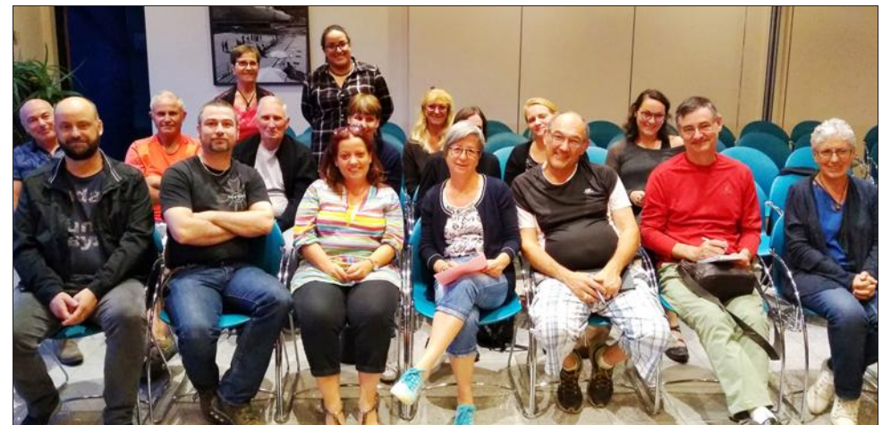
Une première réunion avait lieu cette semaine.

Les représentants des associations ont répondu nombreux à l'appel de la commission municipale des associations qui proposait cette semaine une réunion de préparation en vue du Téléthon 2019 (le samedi 7 décembre de 14 h à 18 h avec installation dès 9 h du matin).