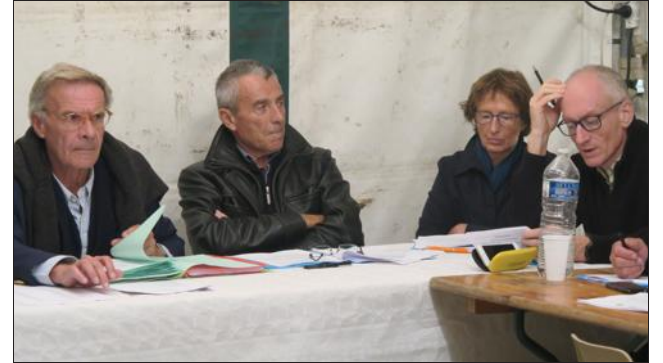
Dans une ambiance plutôt fraîche, les élus ont bien échangé avec la vingtaine d'habitants du hameau de Montouvrard présents lors du conseil décentralisé lundi soir.