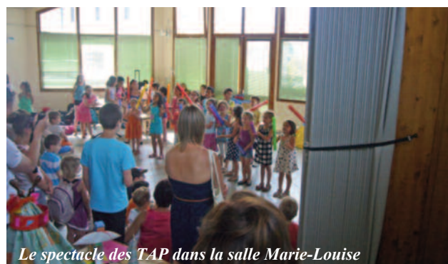
Le spectacle des TAP dans la salle Marie-Louise