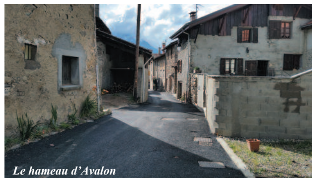
Le hameau d'Avalon

Mobilier scolaire, Acquisition et installation d'un rideau séparateur pour les activités périscolaires de la salle Marie-Louise, Achat de matériel pour le service Technique, Acquisition d'un nouveau logiciel et renouvellement d'une partie du matériel et des logiciels informatiques plus performants et sécurisés. ■