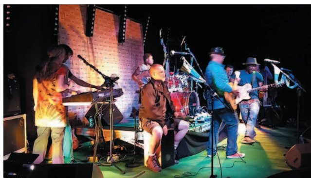
Le concert Kyekyeku