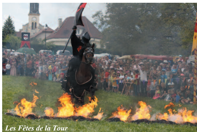
Les Fêtes de la Tour

Et l'élaboration d'un projet, en partenariat avec l'Office de tourisme du Grésivaudan, concernant un parcours patrimonial sur Saint-Maximin.