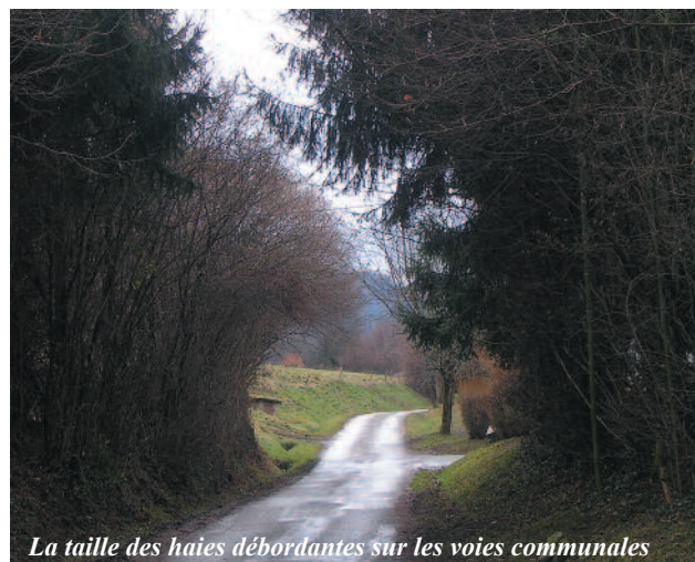
La taille des haies débordantes sur les voies communales