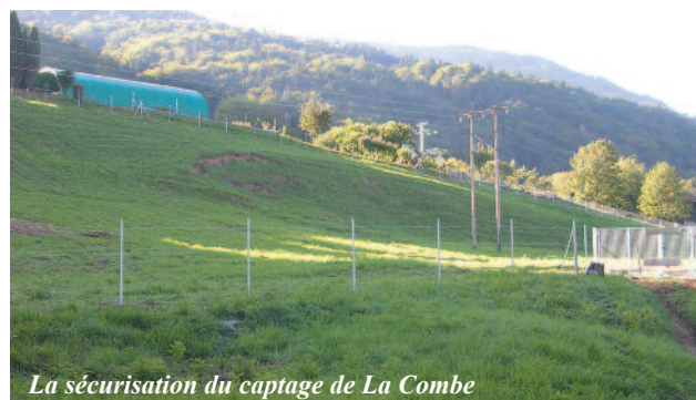
La sécurisation du captage de La Combe