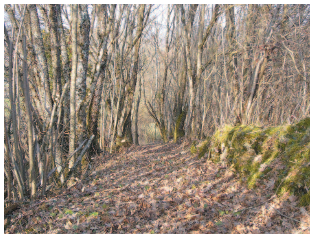
Le sentier du marais d'Avalon